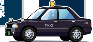
観光タクシー料金(時間貸定額料金)